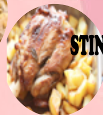
STINCO CON PATATE

entrambi i menù sono comprensivi di: pane - acqua - dolce